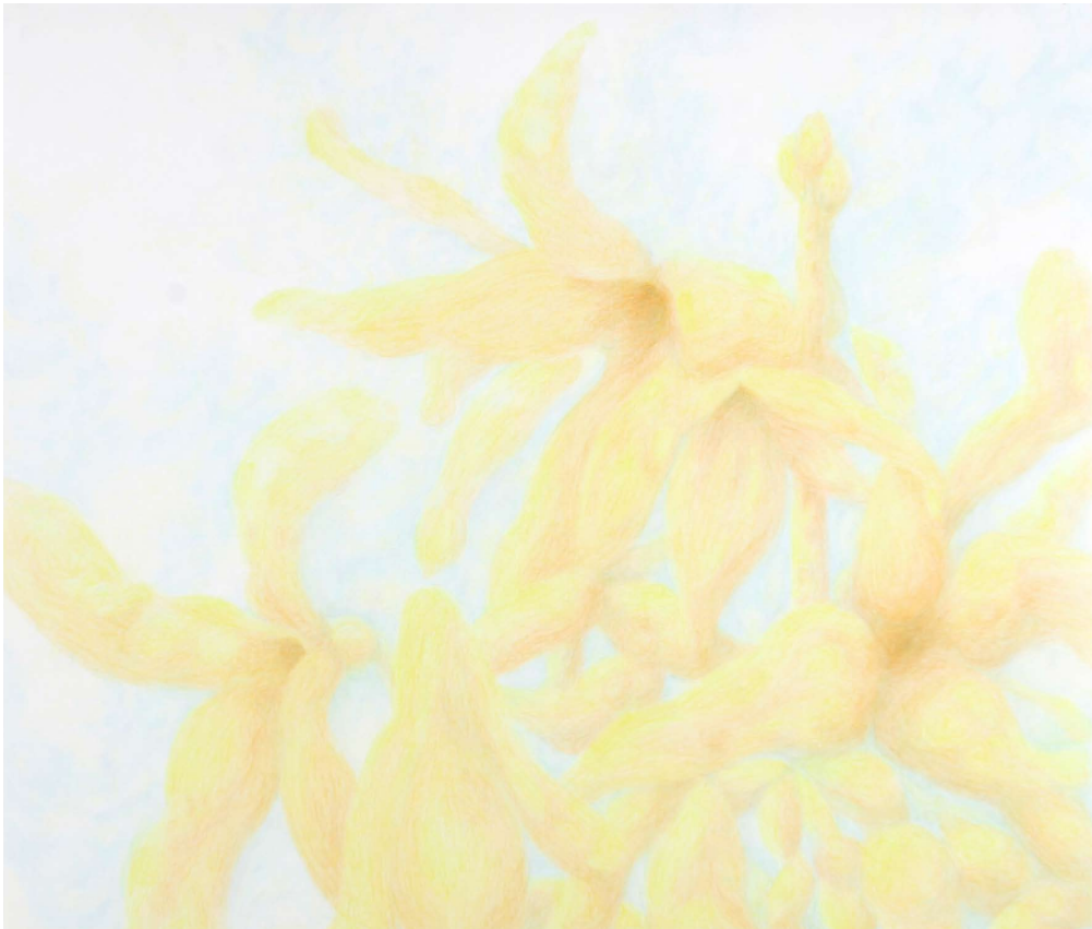
SANS TITRE (CYTISE) / BEZ NÁZVU (ZLATÝ DÉŠŤ)

2011, crayons de couleurs sur papier / pastelky na papíře, 150x165 cm