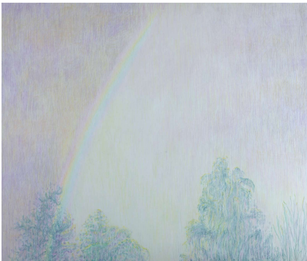
SANS TITRE (ARC EN CIEL) / BEZ NÁZVU (DUHA) 2011, crayons de couleurs sur papier / pastelky na papíře, 150x165 cm