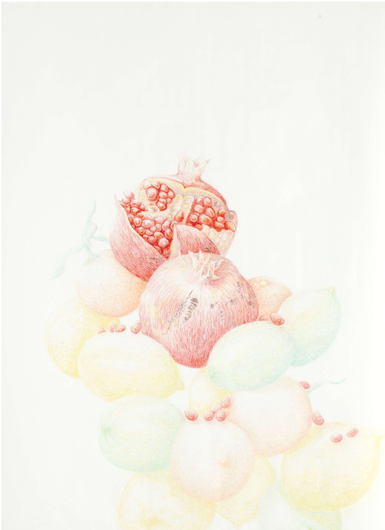
SANS TITRE (GRENADE) / BEZ NÁZVU (GRANÁTOVÉ JABLKO)

2010, crayons de couleurs sur papier / pastelky na papíře, 150x105 cm