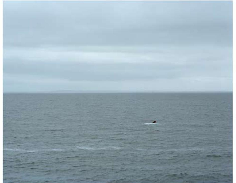
48°24'52" N 4°47'42" O 2010 Tirage lambda 85x108 cm