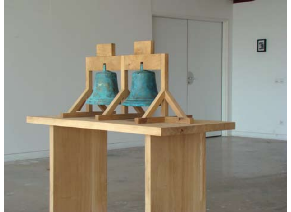
Black Sabbath-Black Sabbath-Black Sabbath 2011 Cloches en bronze (Do, Fa#), Chêne 115x85x35 cm