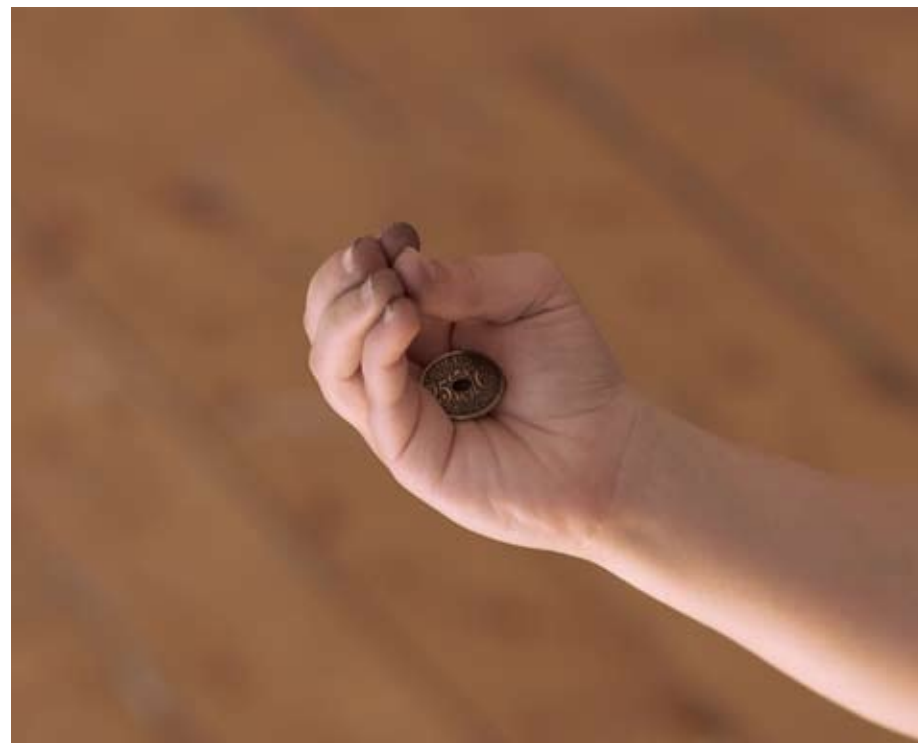
Brezhoneg ne gozi ked (Breton tu ne parleras point) 2009 Tirage lambda contrecollé sur dibond 15x20 cm