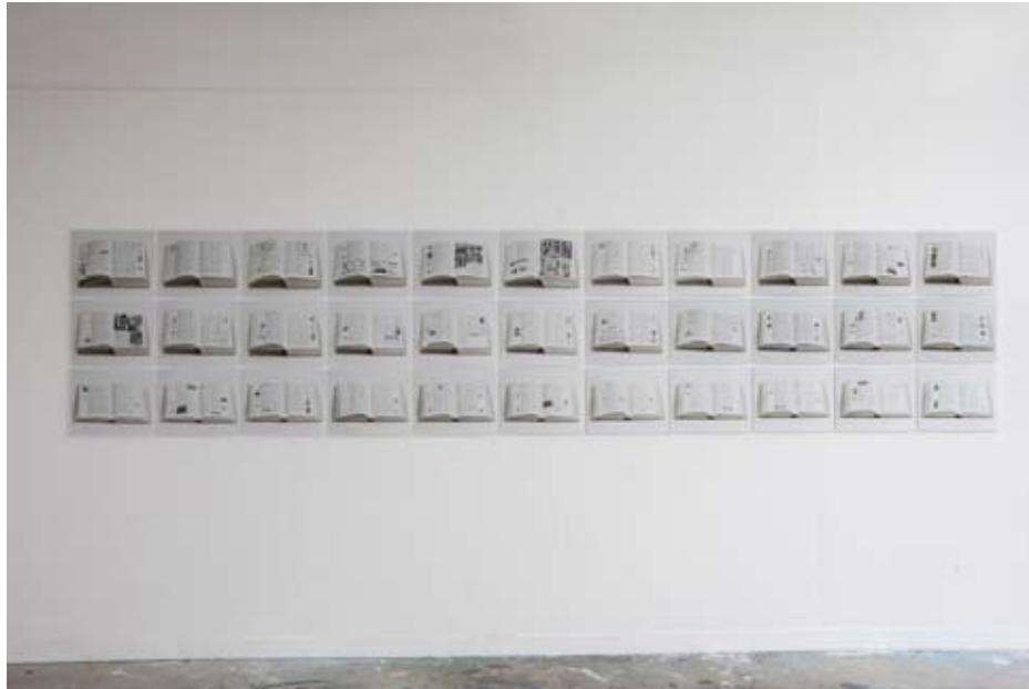
Objet trouvé dans le grenier de ma grand-mère 2011 33 tirages jet d'encre contrecollés 28x36 cm chacune