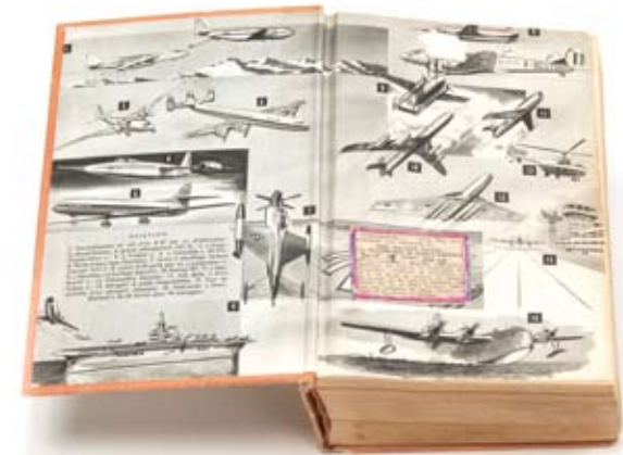
Objet trouvé dans le grenier de ma grand-mère 2011 Tirage lambda contrecollé sur dibond 25x32 cm