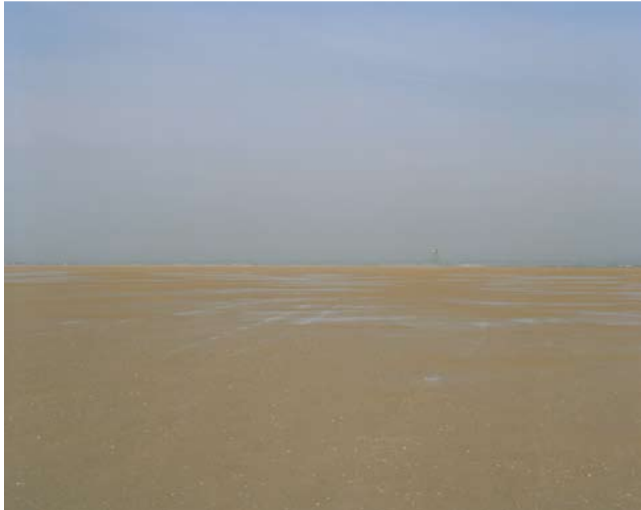
50°59'4" N 1°54'55" E 2010 Tirage lambda 85x108 cm