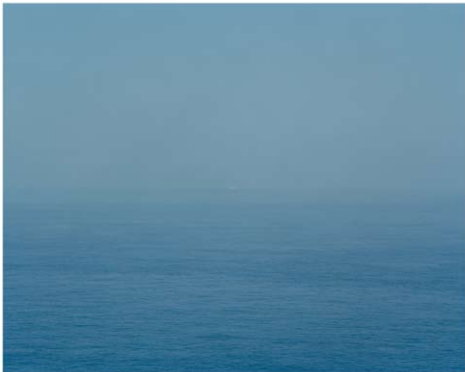
58°38'40" N 3°01'31" E 2011 Tirage lambda 85x108 cm