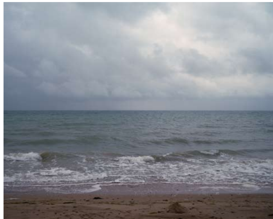
51°08'25" N 1°22'16" E 2010 Tirage lambda 85x108 cm