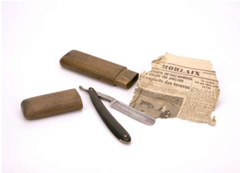
Objet trouvé dans le grenier de mon grand-père 2009 Tirage Lambda contrecollé sur dibond 40x55 cm