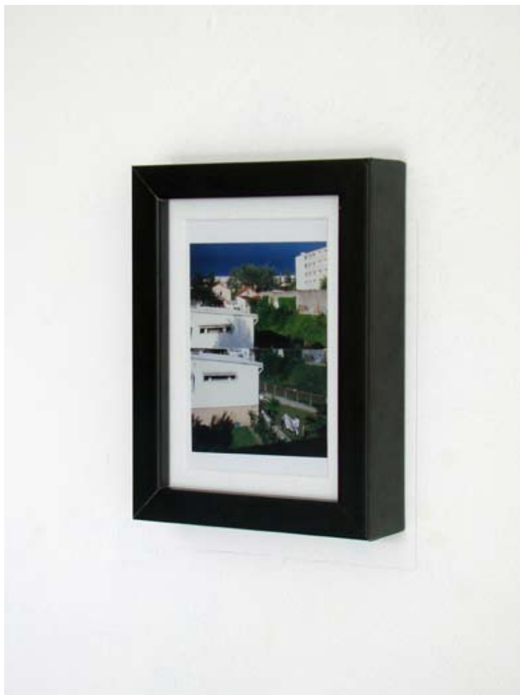
15062010/22062010 2010 Impression jet-d'encre, encadrement 22x16