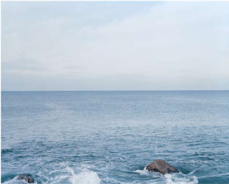
48°02' 11" N 4°52' 43" O 2011 Tirage lambda 85x108 cm